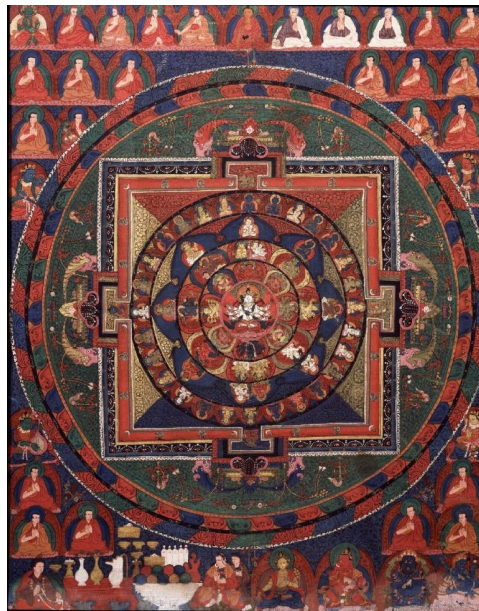
Figura 6. Mandala de Vairocana, Tibet central, siglo XV. Pigmento sobre algodón.