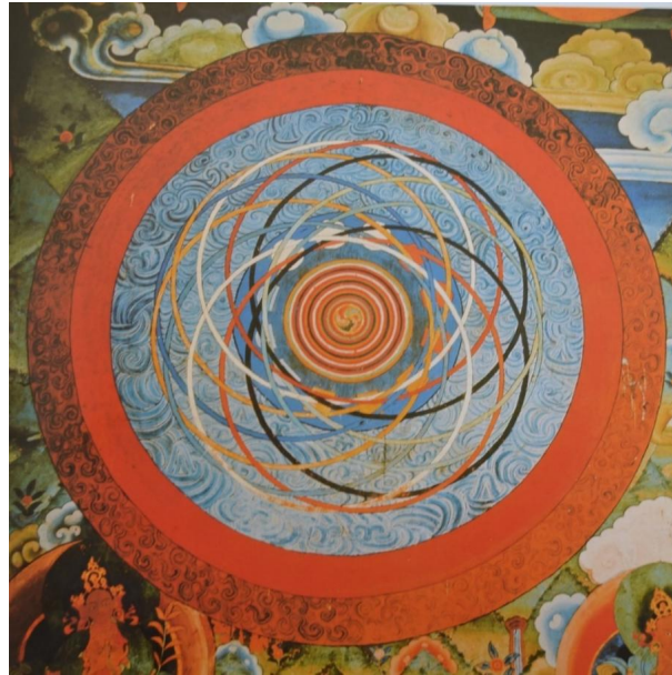
Figura 8. Mandala cósmico. Pintura mural en la entrada al templo principal en Paro Dzong, Bután.

En definitiva, en este laberinto mágico que es el arte del mandala se llega a la mayor expresión del ser, en cuyo centro, la fuente original primordial, uno es el artista absoluto.