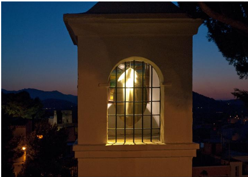
Figura 4. Joan Llobell, Intervención Llanternes (2010) 12 hojas de latón dorado. Peregrinatio, Consorci de Museus de la Comunitat Valenciana (Sagunto) www.joanllobell.es

Hoy en día, el hombre, desorientado por el desequilibrado frenesí de la sociedad moderna se olvida a menudo de Sí Mismo 7 . En la sociedad de la materialidad no se sabe encontrar, ha perdido la visión holística o de la totalidad del hombre primitivo, en la que el mundo es concebido como una realidad no fragmentada de la que todos formamos parte como un todo. (Figura 5) Esta visión de la realidad que se deriva del concepto de mandala, también sería una de las consecuencias lógicas de la actividad artística, como se deduce de las reflexiones de Pierre Hadot en referencia a la poesía de Goethe, al recordarnos la tradición ancestral de ascensión a una montaña para alcanzar una “mirada desde lo alto”, otra percepción de la vida y de uno mismo.