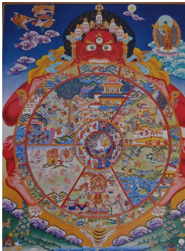
Figura 1. Mandala de la Rueda de la Vida (Ilustración actual, anónima) Fuente: “ Mandala Calendar, sacred circle of enlightenment, 2141 Year of Wooden Hor ”

En el extracto de esta investigación que presentamos nos centramos en el estudio del mandala en el arte de la cultura tibetana desde el contexto de su tradición filosófica y espiritual que se acerca a una manera de entender el cosmos como una gran totalidad de la que el hombre es partícipe en comunión con la naturaleza y demás seres. El arte y la filosofía de la tradición budista nos muestran una visión holística del mundo en la que el hombre, sus realidades interiores y el universo que le rodea están íntimamente interrelacionados 1 .