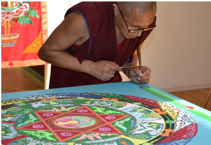
Figura 3. Realización de Mandala de arena de Vajrayogini. Casa del Tíbet, Barcelona, España, junio 2016.

Por otro lado, la multidimensionalidad del concepto mandala nos ha obligado a abordarlo desde otras áreas de conocimiento que no contemplamos en este texto, pero sí en nuestra investigación. En sus múltiples lecturas, el mandala puede ser estudiado a través de la óptica del arte, la filosofía, la espiritualidad, la ciencia y la psicología, lo que nos permite tener una visión más global de la diversidad de todas las realidades y lecturas que abarca.