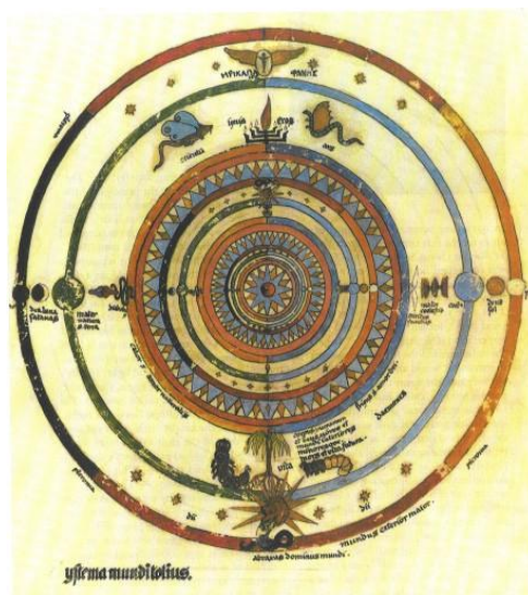
Figura 2. Carl Gustav Jung, “Mandala of a Modern Man” (1916). Fuente: “Mandala Symbolism”

El diseño del mandala se estructura en base a un centro y sus alrededores, adquiriendo relevancia las cuatro direcciones espaciales. Carl Gustav Jung considera las imágenes de mandalas como revelaciones del “sí mismo”, como símbolos de unión entre el interior y exterior que nacen de nuestro inconsciente colectivo (Figura 2). En esta línea, el investigador orientalista Giuseppe Tucci describe el mandala como un psico-cosmograma, reflejo de la psique y de la proyección geométrica del mundo 2 .