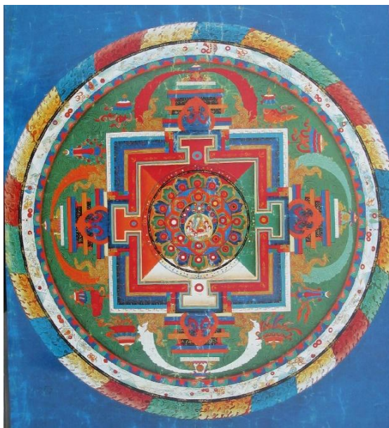
Figura 7. Mandala de Padmasambhava, Tibet, linaje Nyingmapa, siglo XV. Pigmento mineral sobre algodón. Fuente: Colección Wisdom Publications

El vacío entendido como espacio “ es la fuerza que todo lo une y lo entrelaza (...) El vacío libera el acaecimiento de las cosas; es el medio de su rítmica aparición y desaparición ” 22 . Esta visión de la realidad y de la vacuidad como principio único nos proporciona un nuevo paradigma holográfico del mundo. En definitiva, los límites del hombre y del mundo puede decirse que son los límites de la conciencia humana y superarlos equivale a una transformación, a una renovación del hombre y de la conciencia.